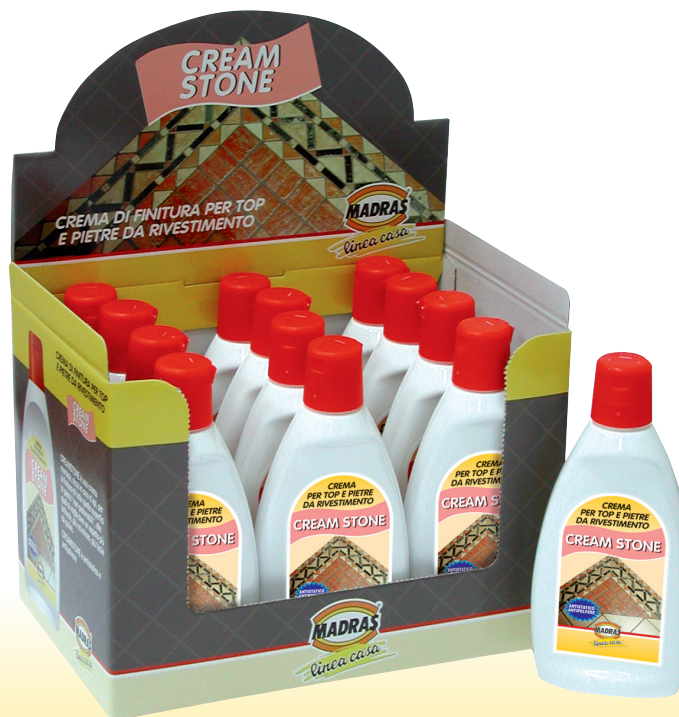
Espositore da banco